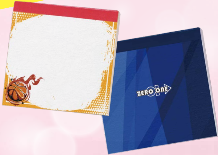
standard memo die cutting memo